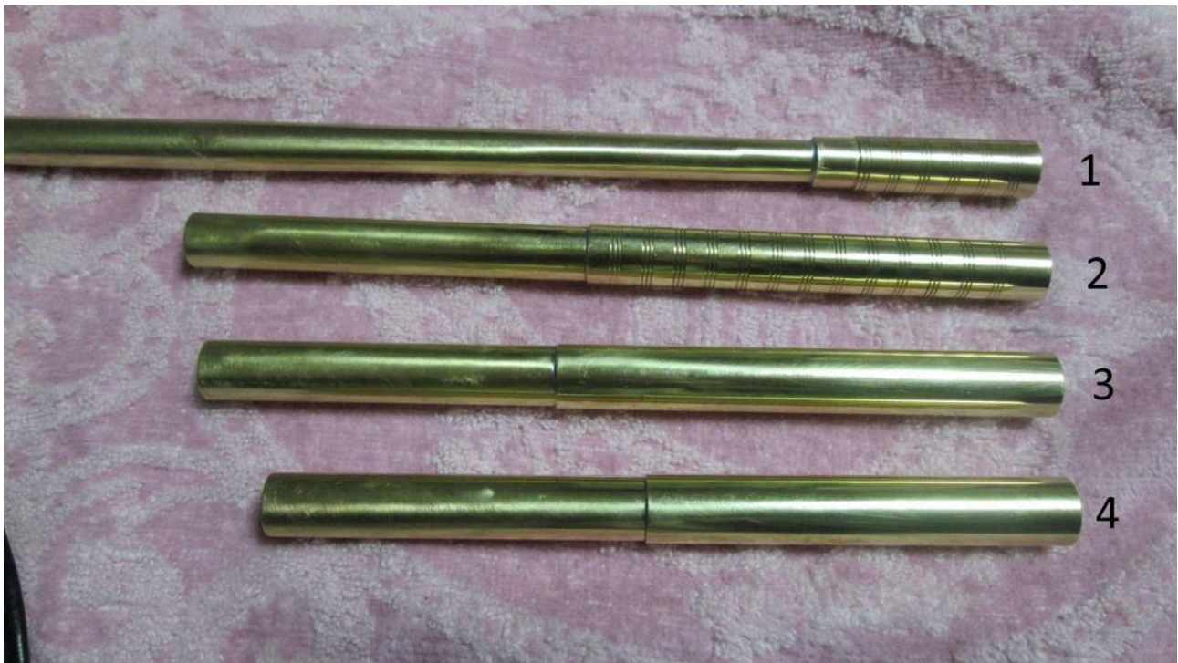
Canna d'imboccatura e prolunghe